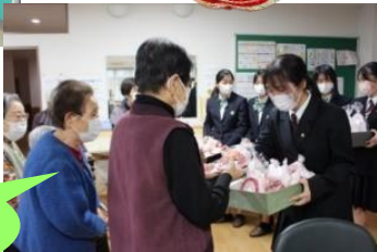
福祉施設「菜の花」に贈りました