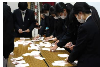
開票作業も体験しました