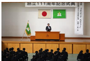
大久保校長による式辞

11月7日（火）、山門高校創立111周年記念式典が執り行われました。在校生にとっても、本校の歴史と伝統を改めて感じることができる一日となりました。