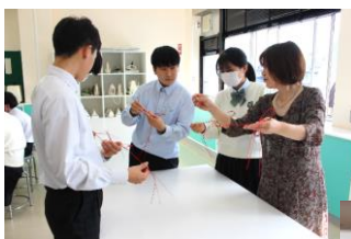
しめ縄制作の様子