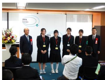
環境副大臣と記念撮影をしました

「ニホンウナギの絶滅を回避するための広葉樹の森づくり」と題して、活動内容を発表しました。