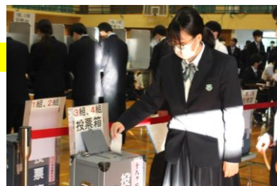
実際の選挙で使われる投票箱を使って投票しました

模擬投票を行った生徒は、「投票の雰囲気や流れを知ることができた。若者の選挙離れによって、高齢者向けの政策が目立つと聞いて、若者にとっても良い政治をしてもらうために投票率を上げたいと思った」と話しました。